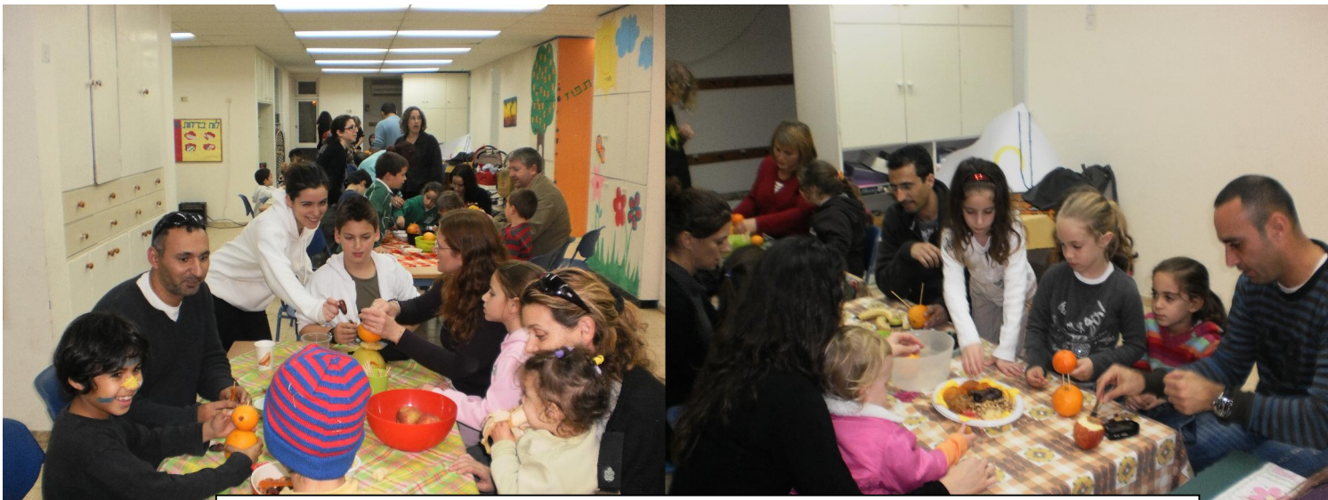
ילדי "תפוז" והוריהם חוגגים את ט"ו בשבט בבית הילדים.

שבט הוא החודש החמישי בלוח השנה העברי, המתחיל בחודש תשרי. שבט הוא חודש, שחורף ואביב נפגשים בו - הוא הגבול בין שיא החורף לראשית האביב. מזלו של חודש שבט בגלגל המזלות הוא דלי, משום שהוא עשיר בגשמים, ככתוב: "יזל מים מדליו" (במדבר כד, ז). לקראת סוף החודש מתמעטים הגשמים ומתחילים להופיע סימני האביב. העצים מתחילים לבלב (להוציא עלים), והראשון שבהם הוא עץ השקד הנקרא גם שקדיה. גם השדות מתמלאים בפרחי בר, והארץ מתחילה להתכסות בכלניות, בנרקיסים, ברקפות ובשאר פרחי אביב בשלל צבעים.