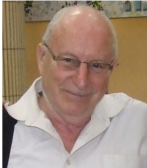
סיפור מהחיים-תלאתיו של אסיר ציון