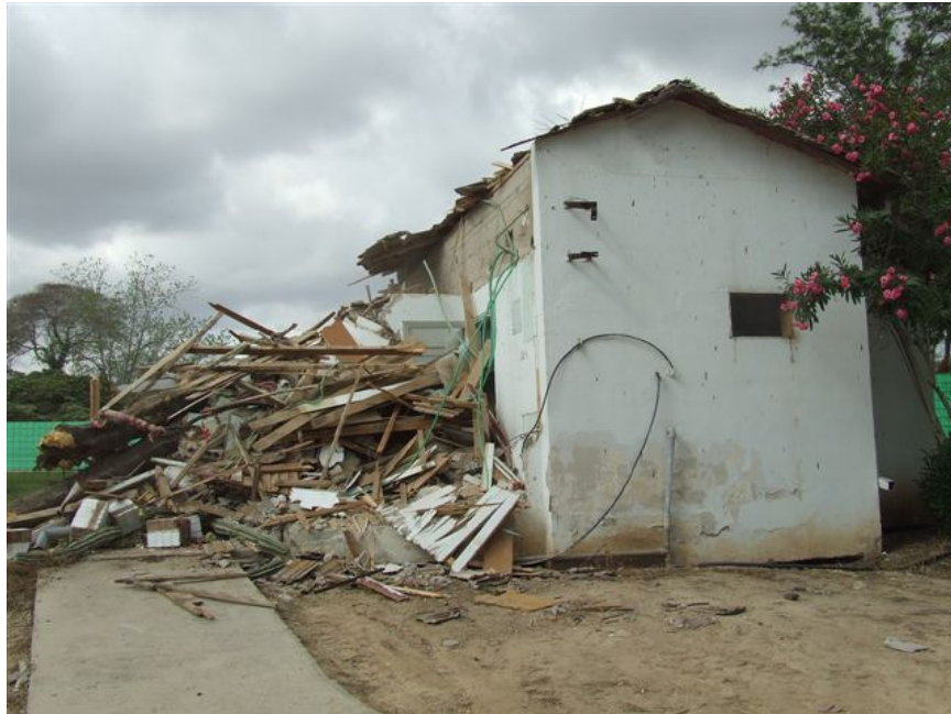
בנין המספרה הישנה -נהרס ובמקומו יוקם בית חדש.